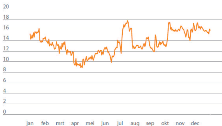
Value at Risk in miljoenen euro's in 2010