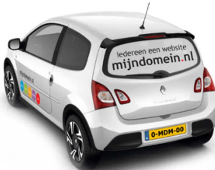
Afbeelding 3 - Renault Twingo voorzien van Mijndomein.nl reclame