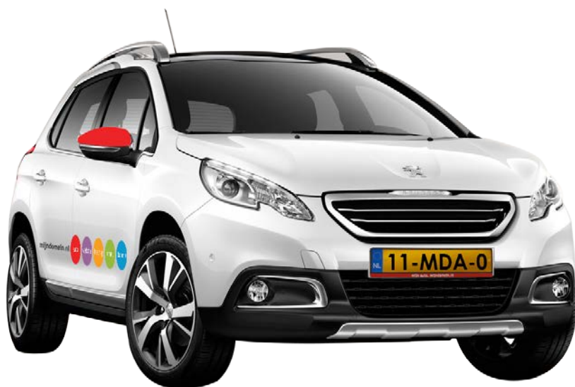
Afbeelding 2 - Peugeot 2008 voorzien van Mijndomein.nl reclame