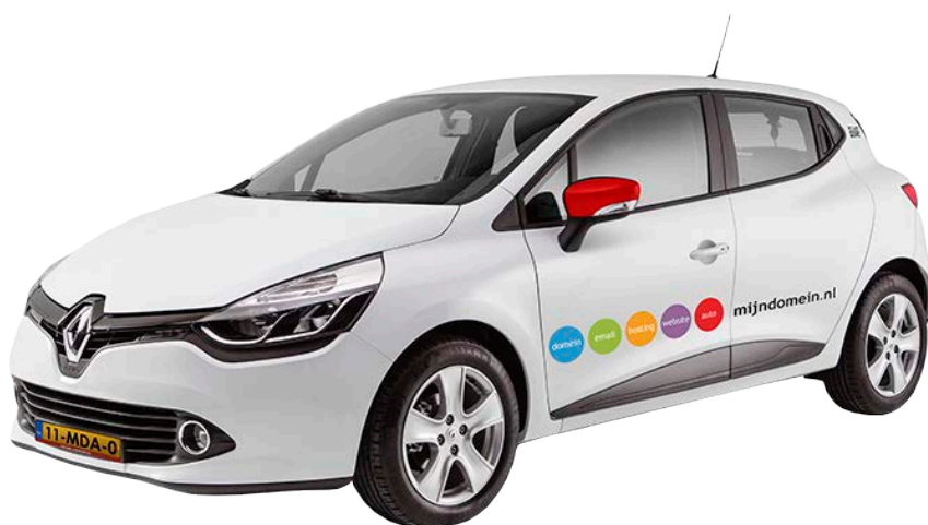
Afbeelding 4 - Renault Clio voorzien van Mijndomein.nl reclame

Standaard autoleaseproducten zijn niet transparant. Zo geven de meeste autoleasecontracten ruimschoots gelegenheid aan de leasemaatschappij om tussentijds de tarieven te verhogen, bijvoorbeeld bij afwijkende kilometrages of door een jaarlijkse aanpassing van het verzekeringstarief. Het autoverhuurproduct van Mijndomein.nl Offline B.V. daarentegen bevat geen verborgen kosten en kan alleen worden aangepast als gevolg van overheidsmaatregelen. Het all-in tarief is vast gedurende de looptijd. Meerkilometers hebben een vaste prijs en het verzekeringstarief wordt niet aangepast. Daarnaast weet een huurder van tevoren wat de boetes voor schade en voortijdige beëindiging van de huur zijn.